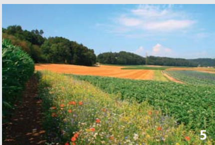
In der Kulturlandschaft können Blühstreifen auch als Verbindungskorridore, z. B. für Laufkäfer, eine wichtige Rolle spielen.